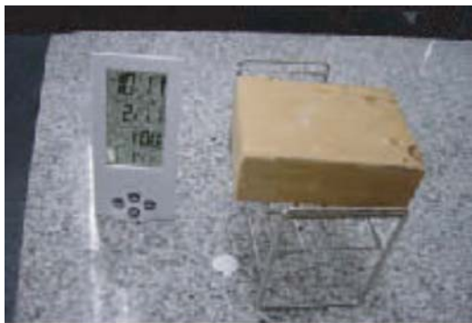
1600°C로 발화 개시 5분