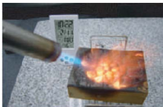
발화장소는 점차 넓어졌지만 불에 타지는 않는다